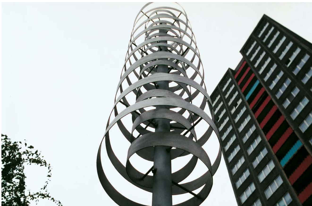
10.19200 dubbele helix

Dubbele helix bestaande uit een roestvrij-stalen staander waarop een binnen- en een buitenspiraal vervaardigd van bandstaal zijn gemonteerd. Met behulp van een handrad kunnen de spiralen worden rondgedraaid.