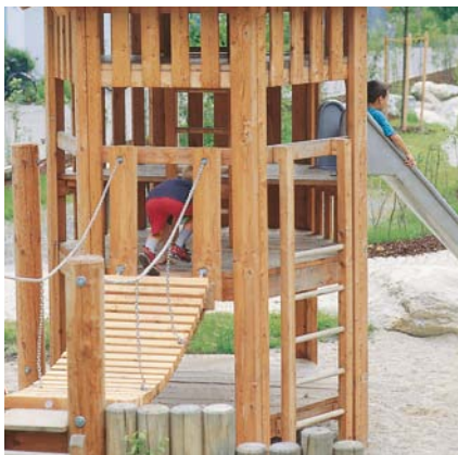
zeshoektoren met glijbaan en hangbrug