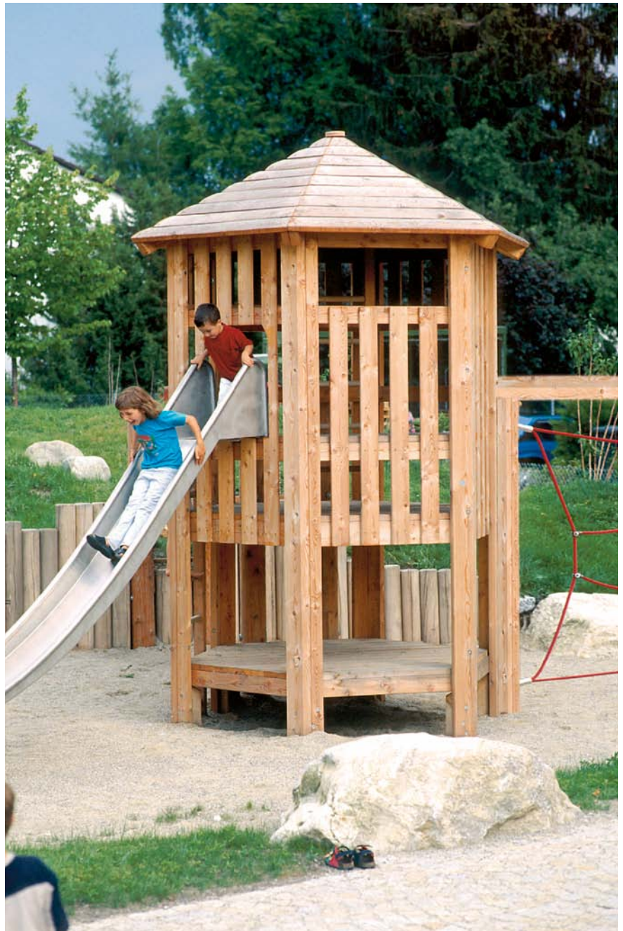
zeshoektoren met glijbaan en klimnet