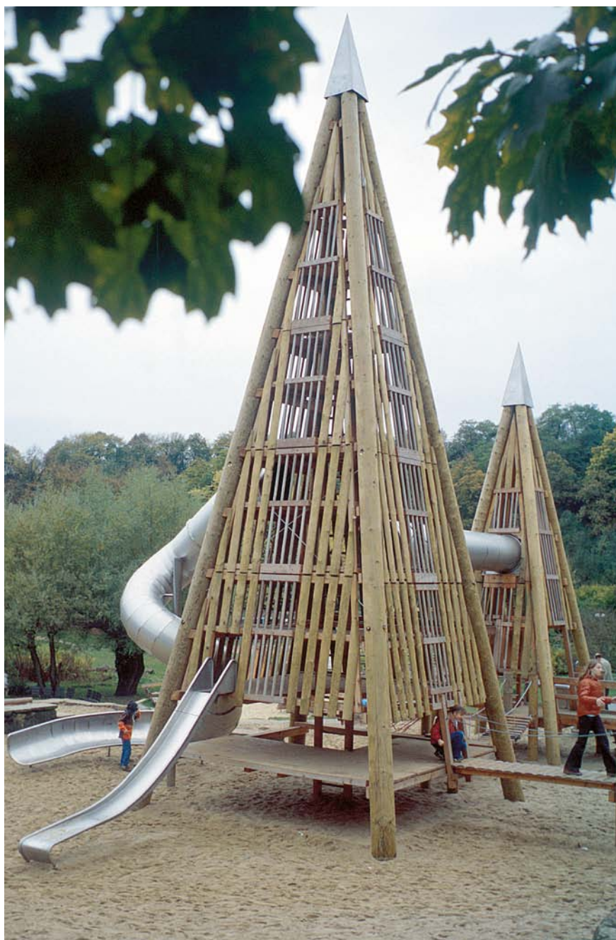
3.43000 piramidetoren H 13,00 m, transparante uitvoering, niet standaard