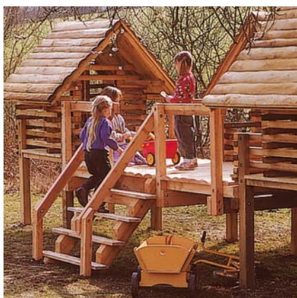
4.10700 huizengroep A, optioneel trap met leuning

Huizengroep 11 bestaande uit een paaldorphan en een platformhuis onderling verbonden met een smalle brug die bereikbaar is via een verticale ladder. Het platformhuis is uitgebreid met platform, een brede glijbaan en een hellend klimnet.