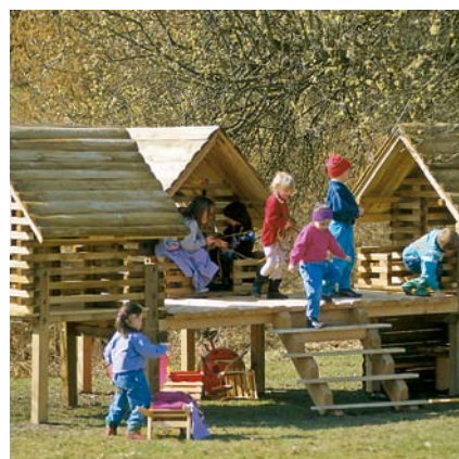
4.10700 huizengroep A, trap en brug