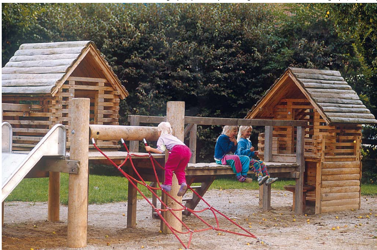
4.11004 huizengroep 11, met ladder i.p.v. trap

Alle huisjes zijn voorzien van doorkijkwanden, een venster, een vloer, een tafeltje en twee zitbankjes. Enkele huisjes hebben ook nog een terrasje met twee zitbankjes.