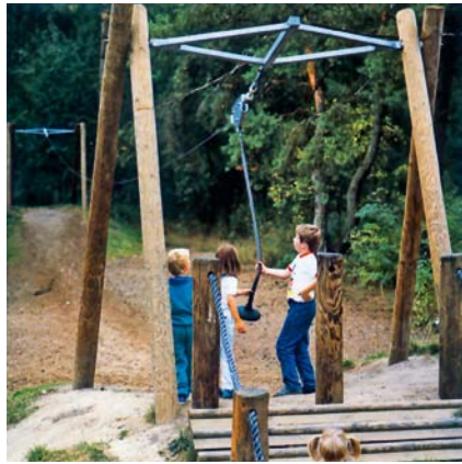
5.52240 kabelbaan tot 30 m, hout

Kabelbaan bestaande uit een begin- en eindstation, opgebouwd uit twee dubbele staanders waartussen een spaninstallatie is bevestigd. Een stalen kabel waaraan twee stootdempers en een r.v.s. loopwagen met rubber slingerzitje zijn bevestigd, verbindt beide stations. De kabel kan worden opgespannen m.b.v. de stalen spaninstallatie aan het beginstation.