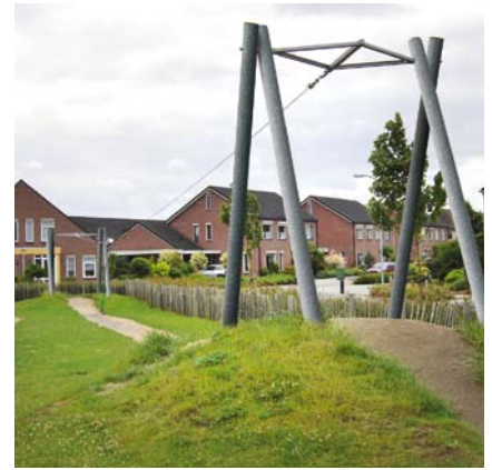
5.52245 kabelbaan tot 30 m, staal