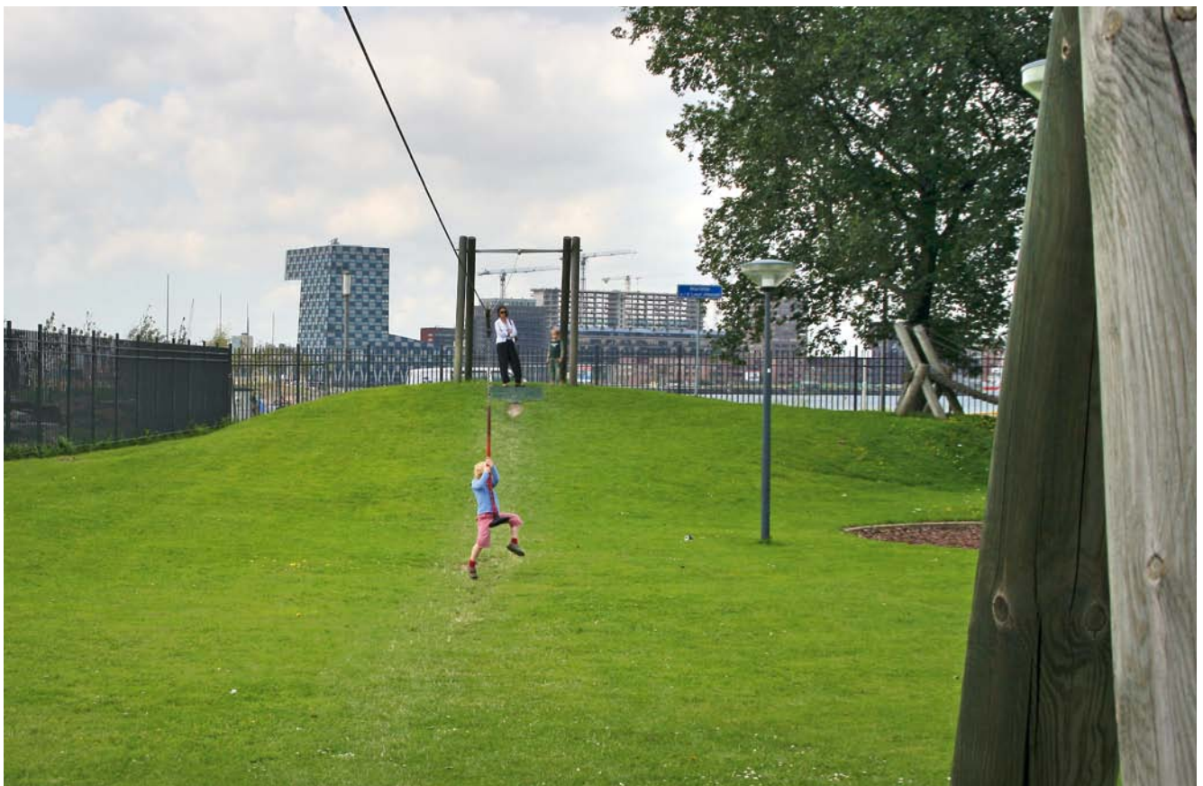
5.52250 kabelbaan tot 50 m, hout

De langste kabelbaan is uitgerust met een spaninstallatie aan beide stations.