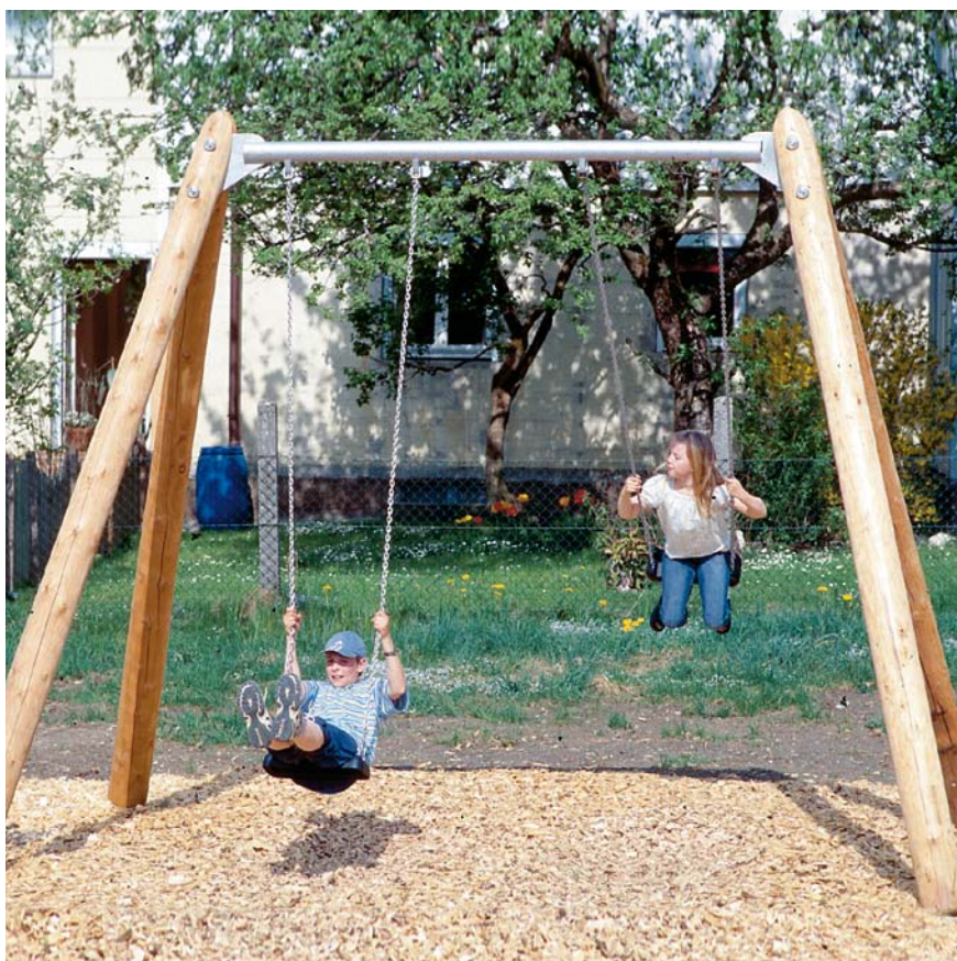
6.14020 dubbele schommel met stalen dwarsbalk