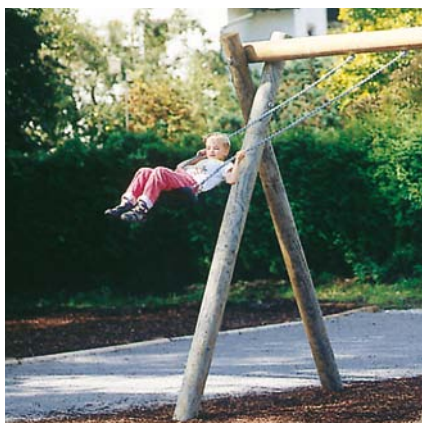
6.13000 enkele schommel