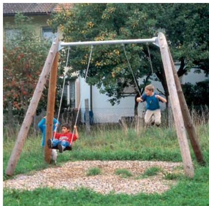
6.14020 dubbele schommel met stalen dwarsbalk