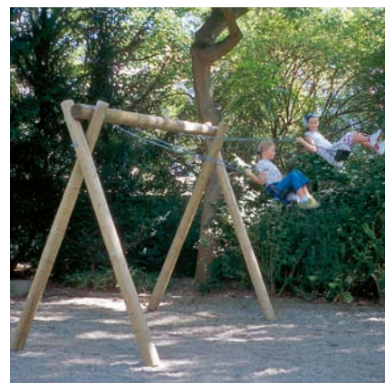
6.14000 dubbele schommel