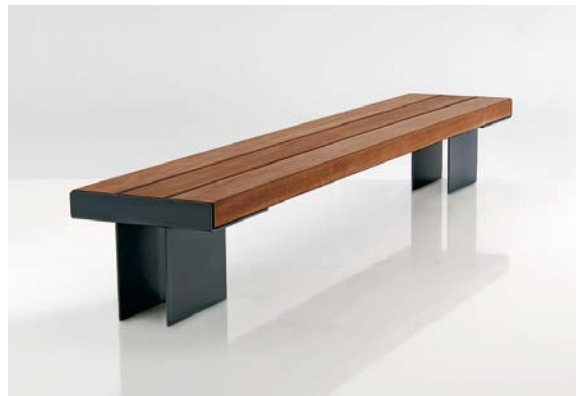
De staalvoeten zijn standaard ijzerglans antraciet DB 703 gelakt.