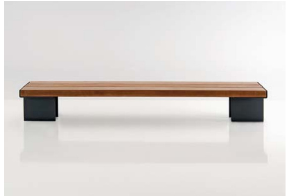
Met drie meter spanwijdte in de kleinste uitvoering is Kaje al een grote bank.